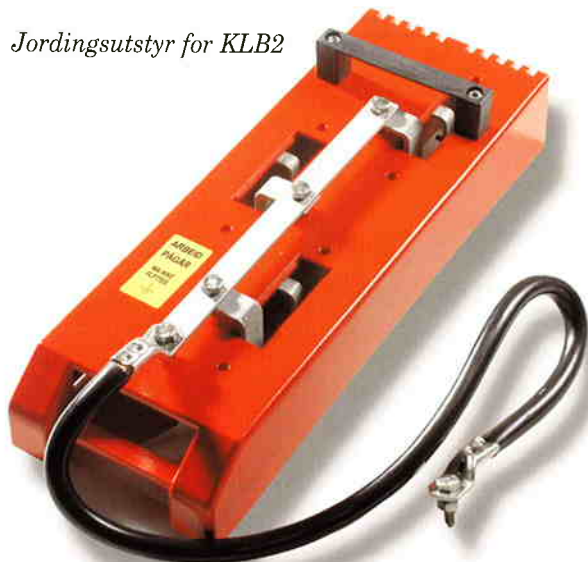
Jordingsutstyr for KLB2

Jordingsmodul for sikringslastbryter KLB 2 400 A. 11 901 08