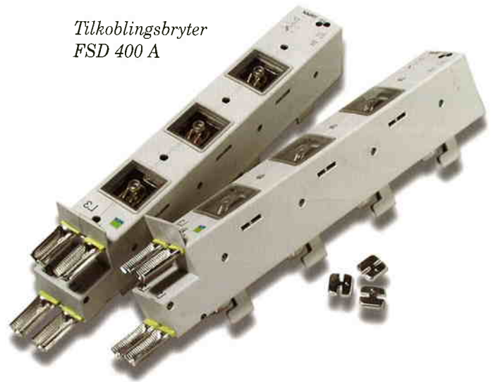
Tilkoblingsbryter FSD 400 A

Kabeltilkoblingsbryter max 400 A. Brytere med enpolig brudd med moment. To lister kan sammenkobles slik at forbikobling av skapet er mulig, samt at skapet kan kobles til og fra. Tilkoblingsklemmer bestilles separat. (KK 50-95, KK 95-150, KK 240). 11 900 46