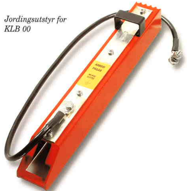
Jordingsutstyr for KLB 00

Jordingsmodul for sikringslastbryter KLB 00 160 A. 11 901 06