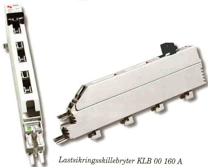
Lastsikringsskillebryter KLB 00 160 A