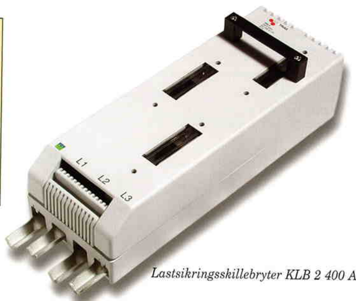
Lastsikringsskillebryter KLB 2 400 A